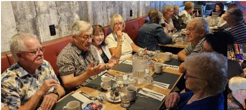
Déjeuner Paspébiac, 16 septembre