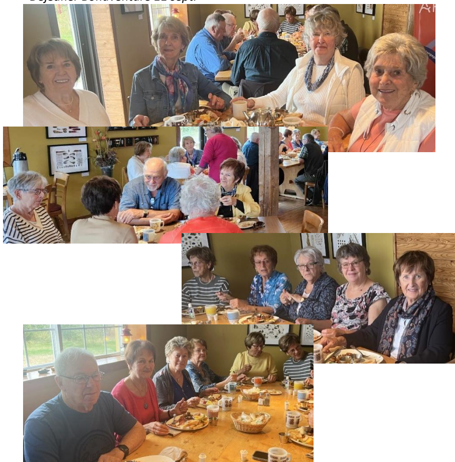
Déjeuner Bonaventure 11 sept.