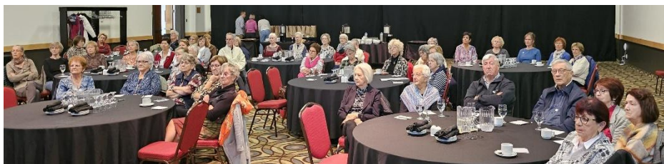
Dîner de la moisson, 9 octobre